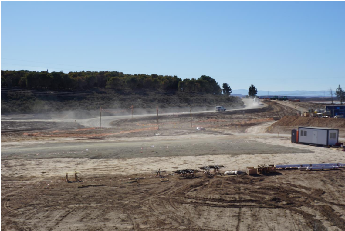
Figura 9 Incidencia subsanada, frecuencia de riego insuficiente