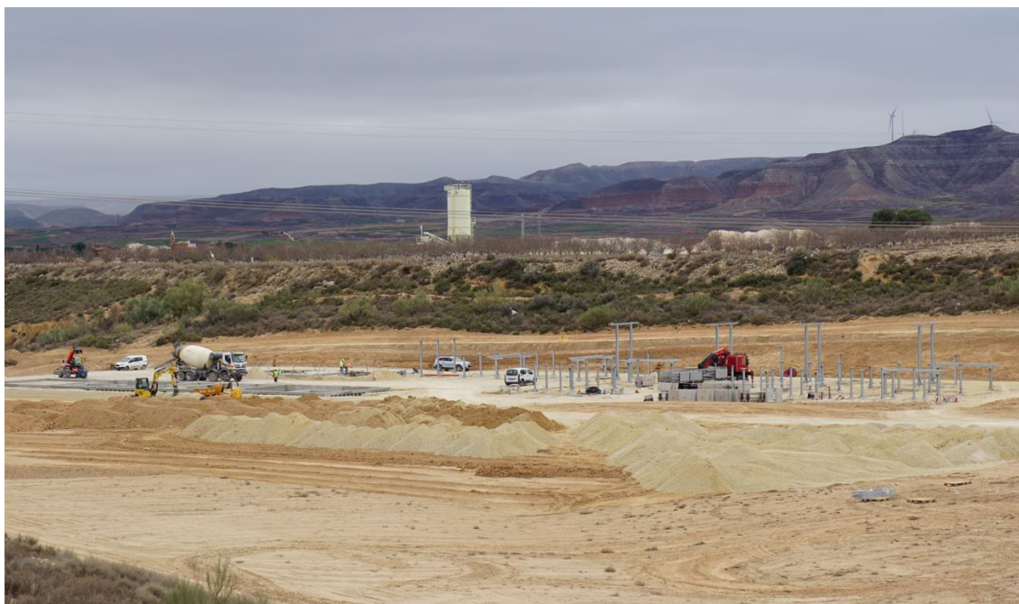
Figura 2a Situación de la subestación eléctrica Vallobar a finales de febrero

Durante este mes han comenzado las obras de construcción de la subestación eléctrica compartida "Vallobar" tras la finalización de la explanación de su superficie, con la instalación de algunos elementos.