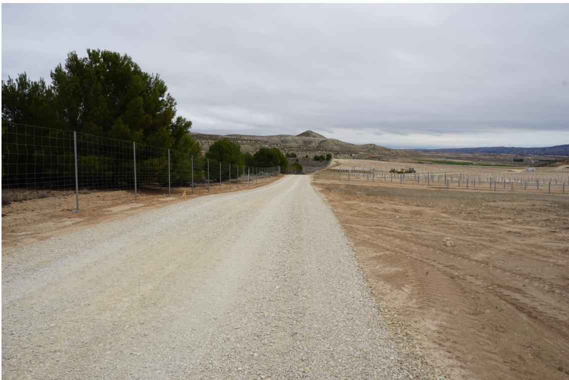
Figura 10 Viales internos y vallado