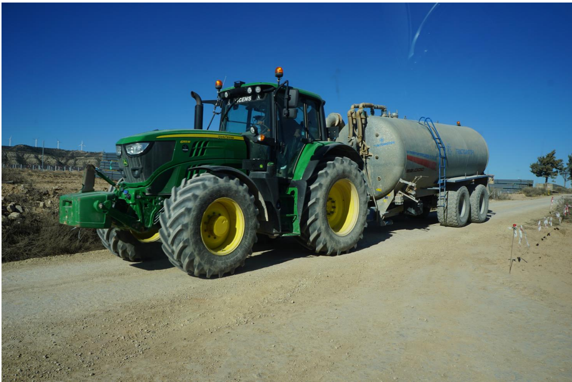
Figura 7 Tractor con cuba para riego de viales