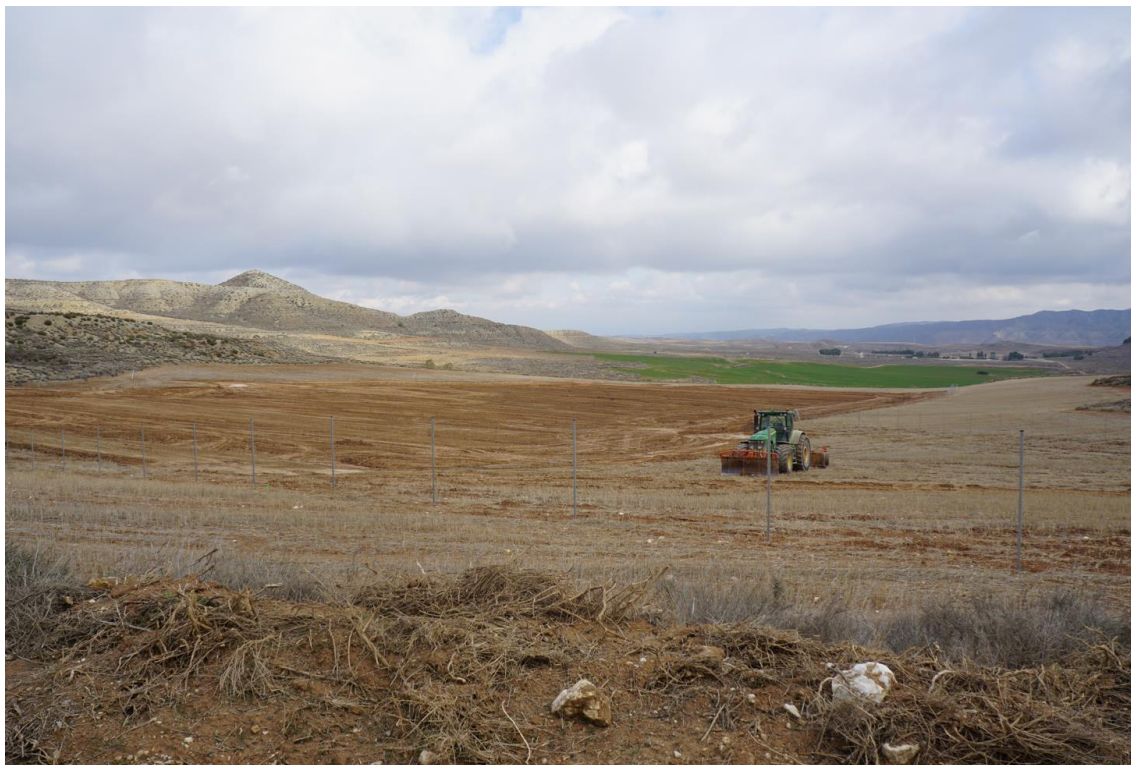
Figura 5 Vallado perimetral instalado en zona noreste de Plana de la Pena 1