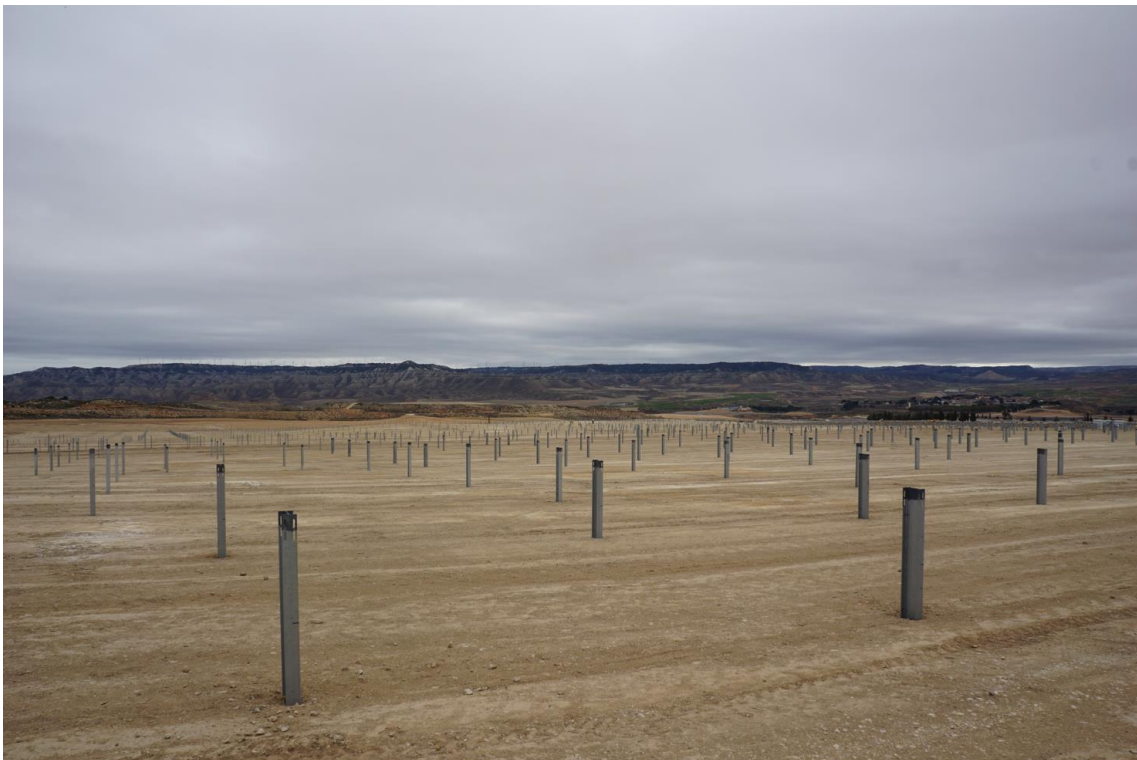
Figura 2b Vista general zona norte de Plana de la Pena 1

Los trabajos de hincado han abarcado durante este mes buena parte de la superficie del parque, habiéndose ejecutado ya al menos en un 80 % del parque. Según finalizan dichos trabajos, se ha iniciado también el montaje de seguidores en algunas zonas.