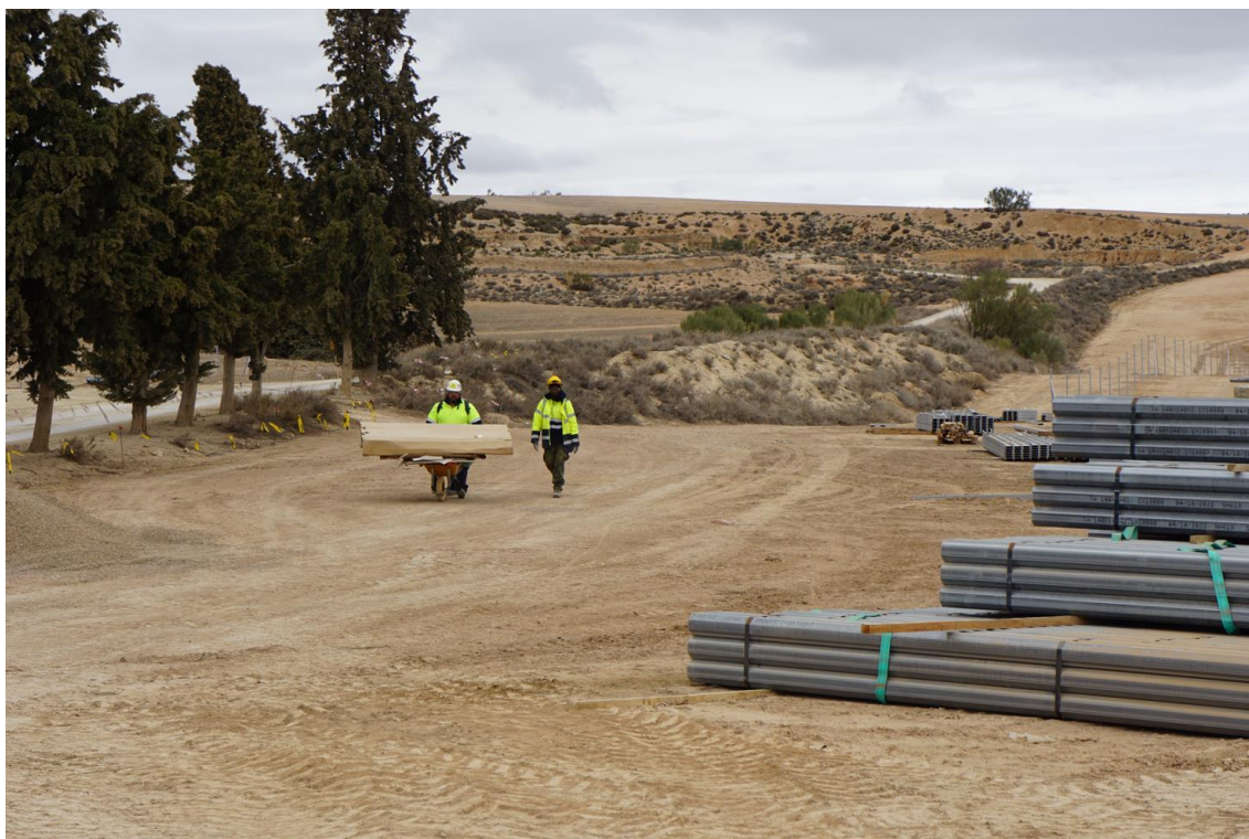
Figura 3 Búsqueda y recogida activas de residuos

Los distintos acopios de material de construcción y zonas de parking de vehículos y maquinaria se han realizado en zonas destinadas para la labor y sobre terreno de cultivo.