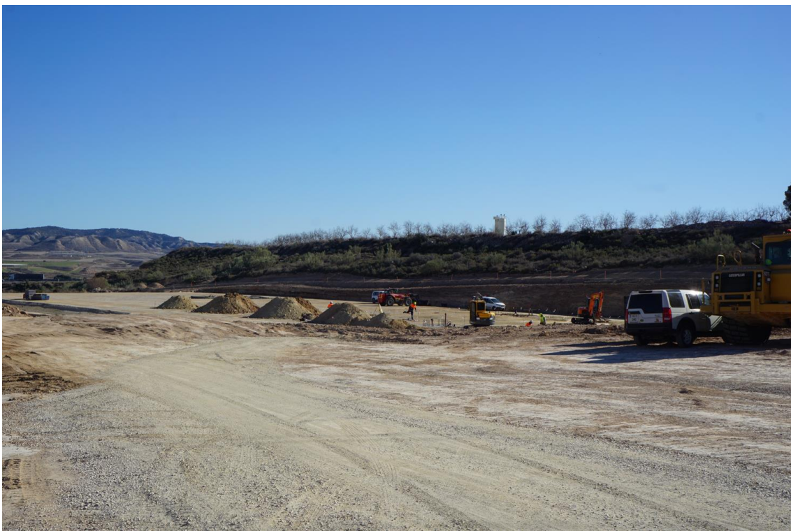
Figura 8 Subestación eléctrica "Vallobar", primera semana de febrero