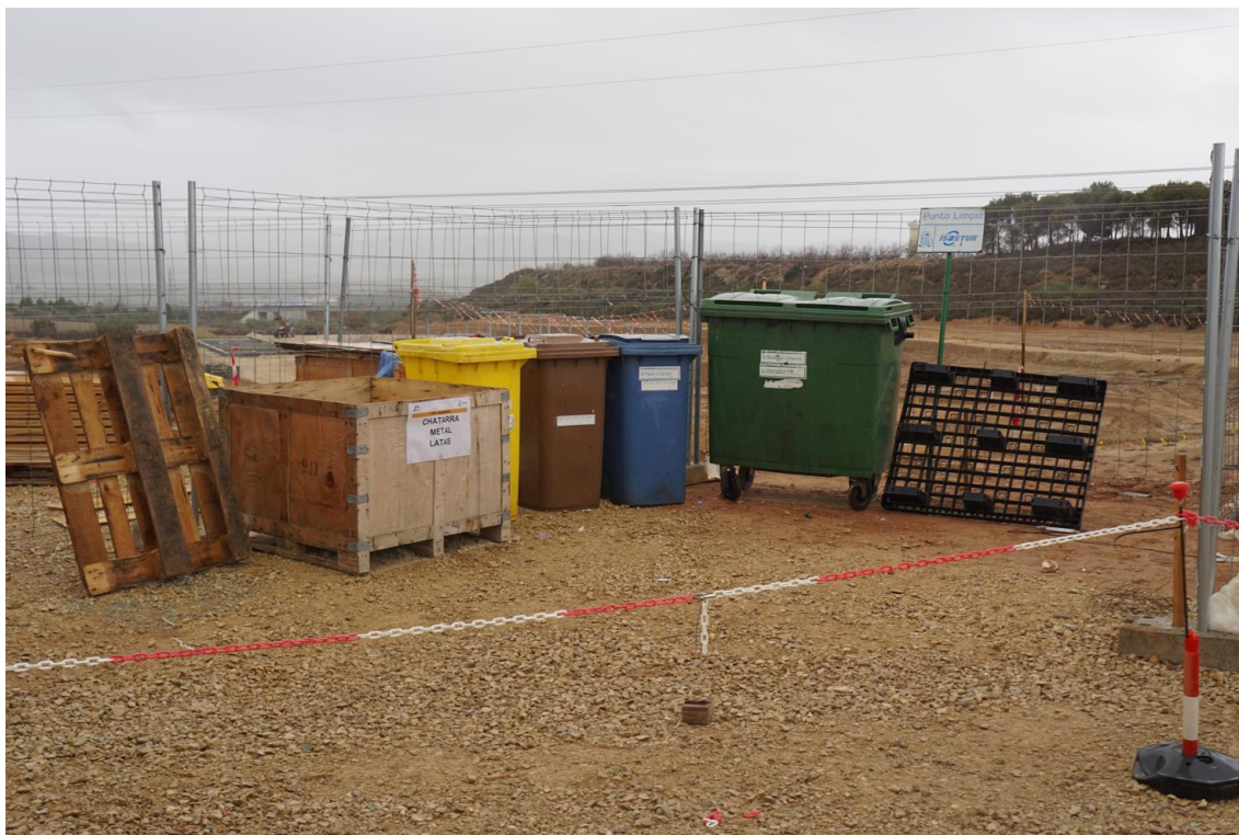
Figura 3 Punto limpio de residuos no peligrosos

En cuanto a los residuos no peligrosos, se ha dispuesto un punto limpio de residuos no peligrosos de la zona de oficinas. Consta de cuatro contenedores, uno para restos plásticos y envases, otro de papel y cartón, uno de residuos urbanos y otro de restos orgánicos. También se han instalado diversos contenedores de gran tamaño para residuo industrial de cartón madera y plástico.