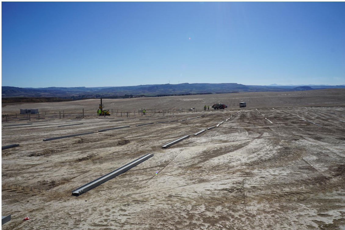
Figura 6 Trabajos de hincado en Plana de la Pena 1

El presente anexo se compone de un número representativo de fotografías del total realizado durante el periodo evaluado, escogidas por su relevancia y/o carácter explicativo para la correcta comprensión del presente informe.